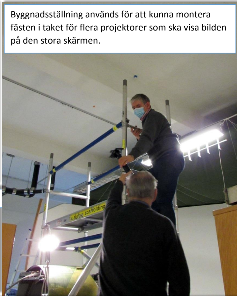
Byggnadsställning används för att kunna montera fästen i taket för flera projektorer som ska visa bilden på den stora skärmen.